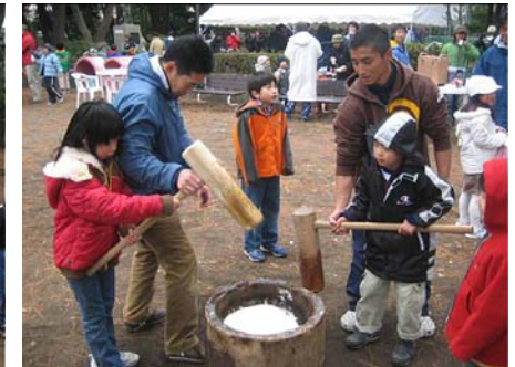
地元町内会との餅つき大会