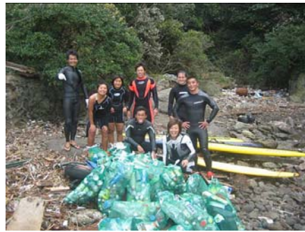
ビーチクリーン／オーシャンクリーン