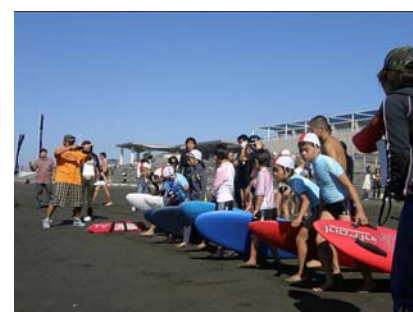
全日本選手権に参加