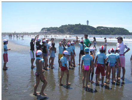
ジュニアプログラム