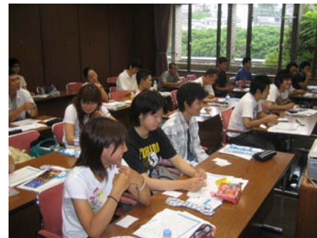
ベーシック講習会